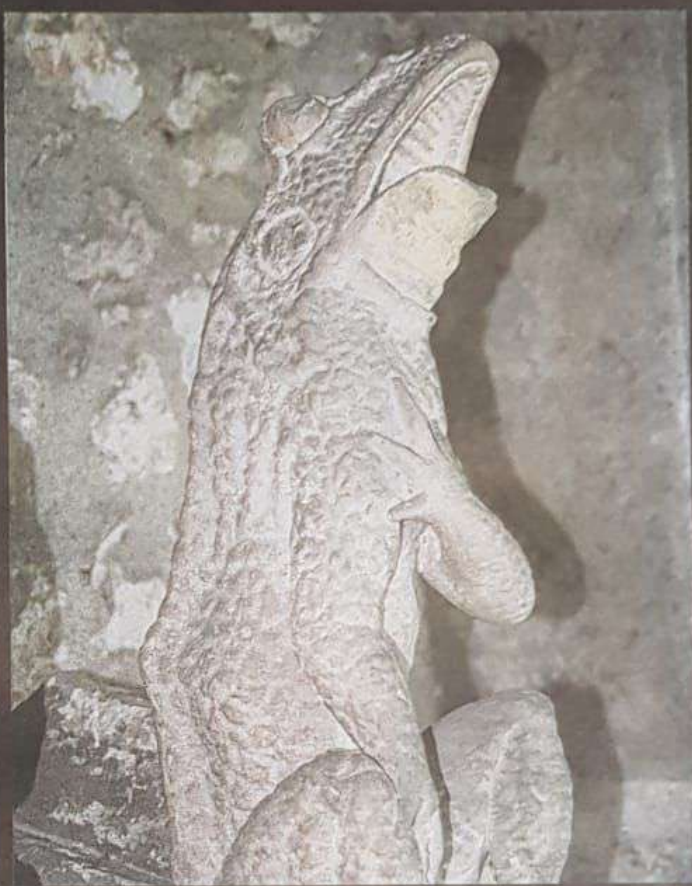
Une grenouille, exposée à l'autre Saint-Saturnin, ce cimetière à galeries peu banal.