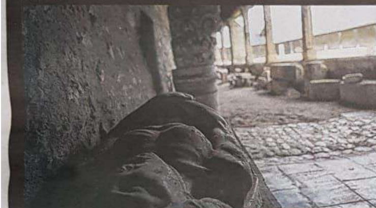
Le lieu, ouvert au public sur rendez-vous et pendant l'escape game, est devenu le musée lapidaire de la ville de Blois.